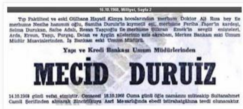
Resim 10 Mecid Duruiz 'in ölüm duyurusu