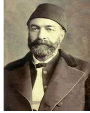
Görsel 1. Abdülhalim Paşa

Hür ve Özgür masonların hepsinin milli masonluğun kökü olarak sahiplendikleri kişi; Osmanlıya karşı isyan etmiş, Mısır Ayanı Mehmet Ali Paşanın oğlu, sabık Mısır prensidir!