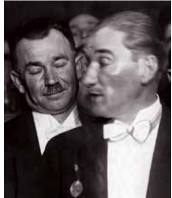
İhsan Eryavuz ve Atatürk

1. Malatya Mebusu Başvekil İsmet Paşa Hazretlerinin takriri. Büyük Millet Meclisi Riyaseti Celilesine. Sabık Bahriye Vekili ve Cebelibereket Mebusu İhsan Beyin Vekâletinin son günlerinde, Yavuz'un tamiri mukavelesinin tadili meselesinde muhilli emniyet bir tarzda, İcra Vekilleri Heyetinin kararı hilafına ve bu kanuni salahiyetinin haricinde hareket ettiği ve Hazinesinin menafîine ademi takayyüt gösterdiği anlaşılmıştır. Vekâleti esnasında ve vekâlet vazifesinden mütehaddis bu harekât kendisinin mesuliyetinin ve Divanı Âliye sevkini müstelzimdir. Dahili nizamnamenin 169'ncu maddesi mucibince hakkında tahkikat icrasını talep ve teklif ederim. Malatya Mebusu Başvekil İsmet. »