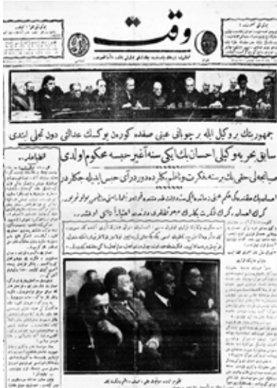
Yüce Divan kararı, Vakit gazetesi, 17.04.1928.