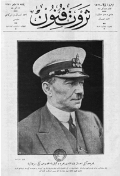
Bahriye Vekili İhsan Eryavuz (Servetifünun, 28.05.1925.)

İnönü mecliste yaptığı uzun konuşmada eski Bahriye Vekili İhsan Bey'in Yüce Divan'da yargılanması önerisinde Atatürk'ün yaptığı uyarının etkisini belirterek: