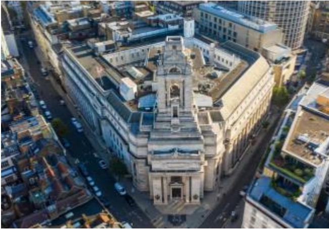
Görsel 4. İngiltere Birleşik Büyük Locası Binası, Londra - 2