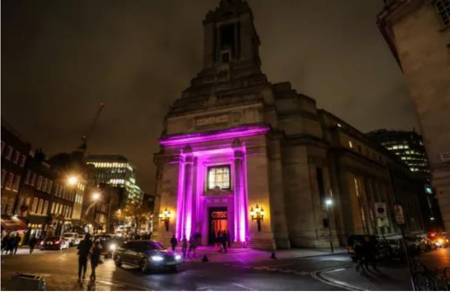
Görsel 3 İngiltere Birleşik Büyük Locası Binası, Londra - 1