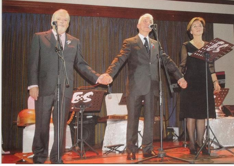
Görsel 11. Ortada Süprem Konsey başı, sağında ÖMBL solda KMBL başları