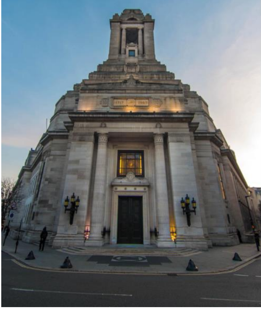
Görsel 5. İngiltere Birleşik Büyük Locası Binası, Londra - 3