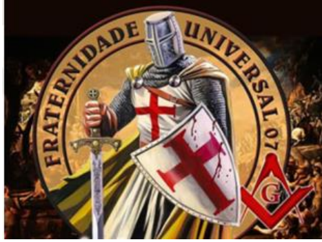
Görsel 9 Haçlı, Tapınak Şövalyesi, kılıcı Türk ve Müslüman kanlı

Aşağıdaki fotoğrafın üzerinde "evrensel kardeşlik" yazıyor. Fotoğrafın ortasında, kanlı kalkanı ve kılıcı ile bir tapınak şövalyesi. Amerika masonlarının paylaştığı bir fotoğraf daha; şövalyenin kanlı kılıç ve kalkanın üzerindeki kan, Türk ve Müslüman kanıdır. Masonların evrensel kardeşlik dedikleri budur.