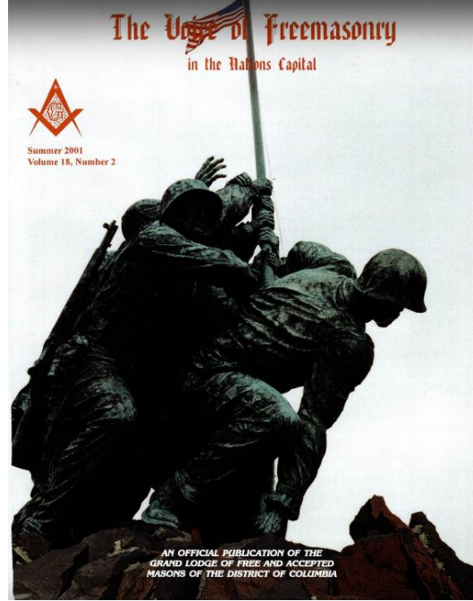
Görsel 7 Amerika masonları, emperyalist ABD ordusunun bayrak dikme fotoğrafını sahiplenir.

Bu konuda tarihsel, toplumsal - sınıfsal, dini, örgüt yapısı hakkında tüm ayrıntıları “ Mason Tarikatı ” kitabımda bulabilir, okuyabilirsiniz. 18