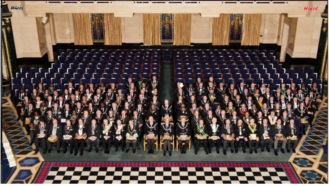
Görsel 2. En önde o dönem Kraliçenin eşi Prens Philip, Bü. Üs. ve arkasında bağımlısı Bü. L. Büyük Üstatları