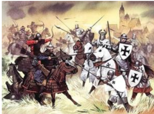
Görsel 10 Timur'un İzmir'i alışı