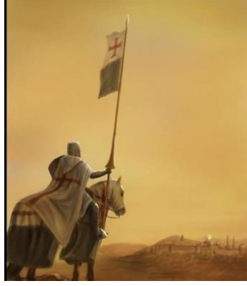
Görsel 8 Müslümanların egemenliğinde olan Kudüs'e saldırmak üzere bir Tapınak Şövalyesi,

Aşağıdaki fotoğrafın üzerinde "evrensel kardeşlik" yazıyor. Fotoğrafın ortasında, kanlı kalkanı ve kılıcı ile bir tapınak şövalyesi. Amerika masonlarının paylaştığı bir fotoğraf daha; şövalyenin kanlı kılıç ve kalkanın üzerindeki kan, Türk ve Müslüman kanıdır. Masonların evrensel kardeşlik dedikleri budur.