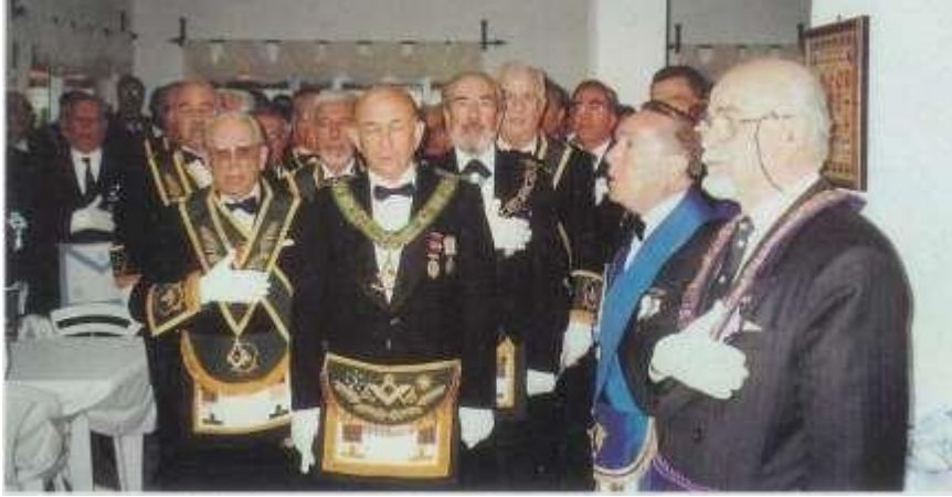
Resim 10. Tapınak Kutsaması 1. Basamak

21 Mart'ta "yeni tapınak salonunun kutsama töreni yapılır.