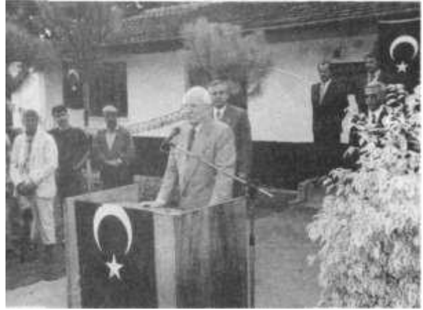
Resim 5. Faşist General Kenan Evren Köyceğiz de Konuşma Yaparken

"Almanya Türkay Muhterem Locası ve Marmaris Muhterem Locasına mensup kardeşlerimiz tarafından 1.369.451 TL harcanarak restore edilen Köyceğiz Kavakarası İlkokulu 10.Ekim.1996 günü Yedinci Cumhurbaşkanımız Sayın Kenan EVREN, Önceki Büyük Üstad Can ARPAÇ, Muğla Vali Yardımcısı, Köyceğiz Kaymakamı ve çok sayıda davetlinin katıldığı bir törenle açılmıştır