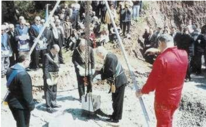
Resim 3. Marmaris Tapınağı Köşe Taşı Koyma Töreni