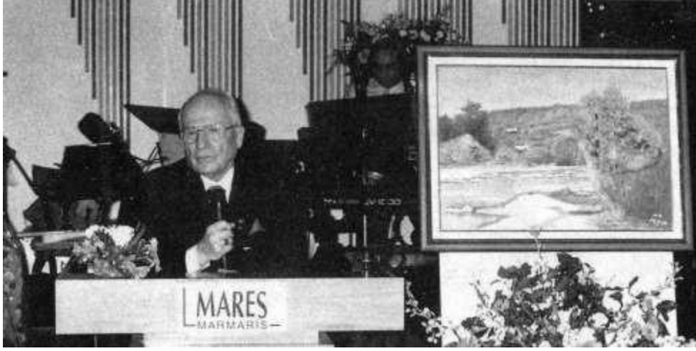
Resim 8. Kenan Evren Konuşma Yaparken, yanında berbat tablolarından birisi.