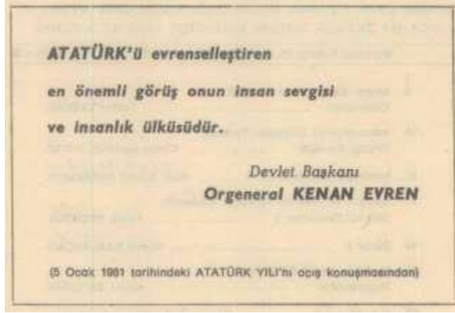
Belge 2. Mimar Sinan Dergisi, 1981, 39. Sayı.

Hür Masonların Kenan Evren'e yaptıkları yalakalık ve Amerikancı faşist darbecilere verdikleri destek karşılığını bulur;