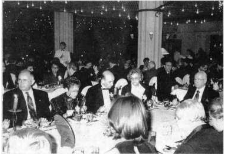
Resim 7. Oturanlar soldan sağa Halit Narin, Bedia Cangör, Tunç Timurkan, Nükhet Arpaç, Kenan Evren

"7. Cumhurbaşkanımız Sayın Kenan Evren'in de katıldığı baloyu Neco Kardeş ve Nükhet Duru Hemşiremiz şenlendirdi. Bu arada, Sayın Kenan Evren'in tarafımıza hediye ettiği bir tablosu, lösemili iki çocuğun yararına, Amerikan usulü açık artırma ile 1.200.000.000 TL sına satıldı. " 13