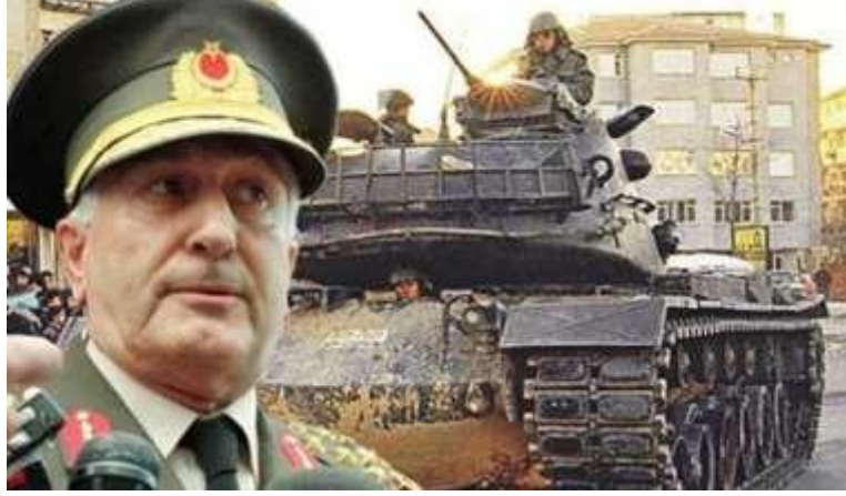
Resim 18. Darbeci Orgeneral Çevik Bir

28 Şubat Yeni Tip Askeri Darbe planlayıcılarından dönemin güçlü ve kilit generali, Amerikancı darbecisi Çevik Bir.