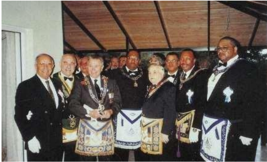
Resim 12. İncirlik Üssündeki Amerikalı Mason Askerler, Marmaris Locası Yeni Tapınağını Ziyaret Ederler.