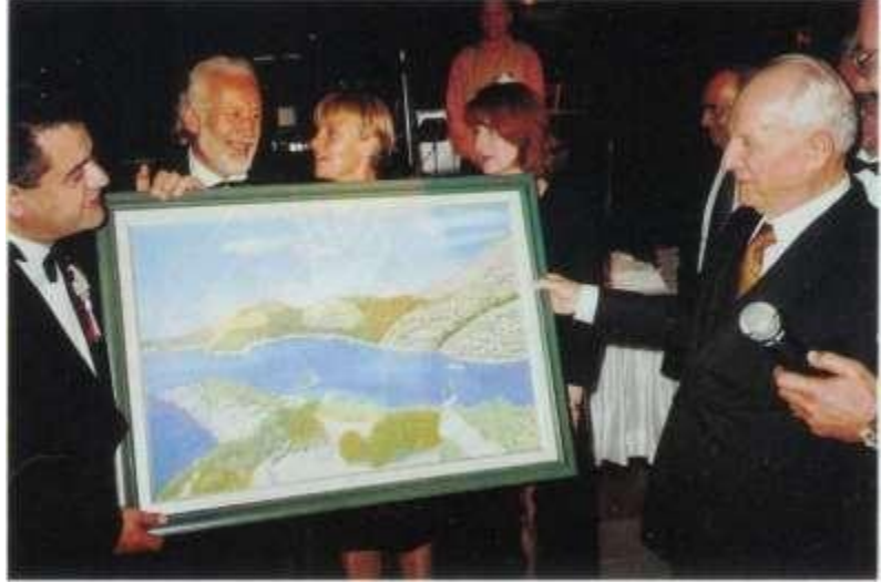
Resim 17. Kenan Evren'in berbat resimlerinden

Kenan Evren'in Marmaris Locasına hediye ettiği tablo, baloda Zeki Alasya'nın satıcılığı ile Amerikan usulü açık artırmada 6 milyar Türk Lirasına satılmış. Tabloya sahip olan kişi, tabloyu Marmaris Locasına hediye etmiş, toplanan para da Kenan Evren Vakfına bağışlanmış.